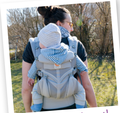
Karoline mit Emil

Fazit: Die Omni 360 Cool Air Mesh ist eine gute Weiterentwicklung zur Adapt, da sie das Vorwärtstragen ermöglicht und auch – so wie die Adapt – von Geburt an verwendet werden kann. Ich mag die breiten, gut gepolsterten und einfach verstellbaren Gurte, die für eine sehr leichte Handhabung sorgen, sowie das Sonnensegel und das Design im Allgemeinen sehr. Mein einziger Kritikpunkt ist der intensive Geruch der neuen Trage. Ich empfehle, sie unbedingt mindestens einmal zu waschen, bevor man sie verwendet.